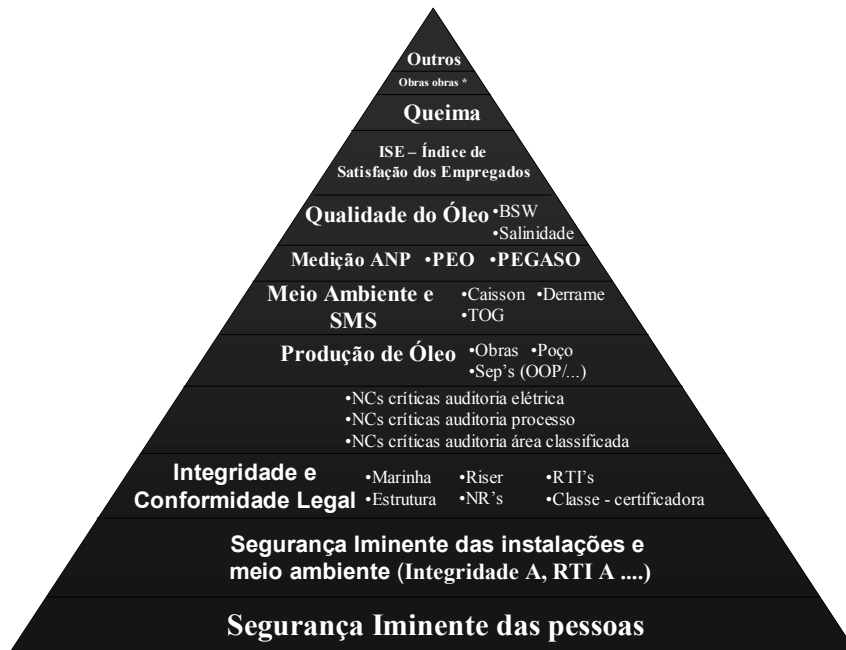
Figura 4: Pirâmide de Maslow – 2009.

O método GUT é utilizado como uma ferramenta de gestão para estimar a prioridade de um problema. GUT é uma sigla para Gravidade, Urgência e Tendência, referindo-se ao problema em questão, Gravidade representa qual o impacto que o problema implica ao negócio, Urgência é por quanto tempo pode-se tolerar o problema e Tendência refere-se à velocidade em que o problema se agrava com o passar do tempo. A dificuldade do método GUT está na sua limitação quanto o número de projetos envolvidos. Quanto maior for o número de projetos, maior será a limitação do método.