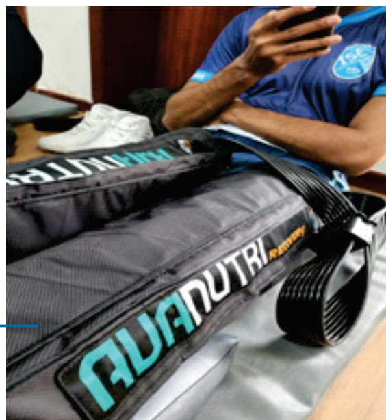
Figura 2: Utilização de equipamentos eletromédicos de ponta na clínica escola de Fisioterapia