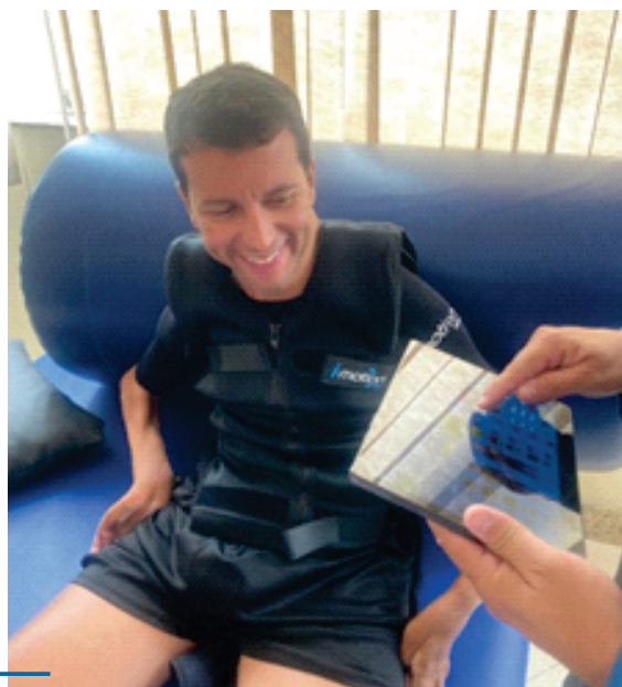
Figura 1: Atendimento à comunidade, na clínica escola de Fisioterapia

Com uma estrutura moderna e equipada com tecnologia de última geração, resultado de parcerias com as maiores indústrias de equipamentos eletromédicos, oferece um atendimento de ponta em diversas especialidades, como traumatologia, fisioterapia esportiva, neurofuncional, pilates, acupuntura, fisioterapia aquática e neuro pediatria funcional.