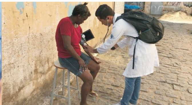
Os cursos da área de saúde do ISECENSA, Enfermagem e Fisioterapia, assistem à comunidade.