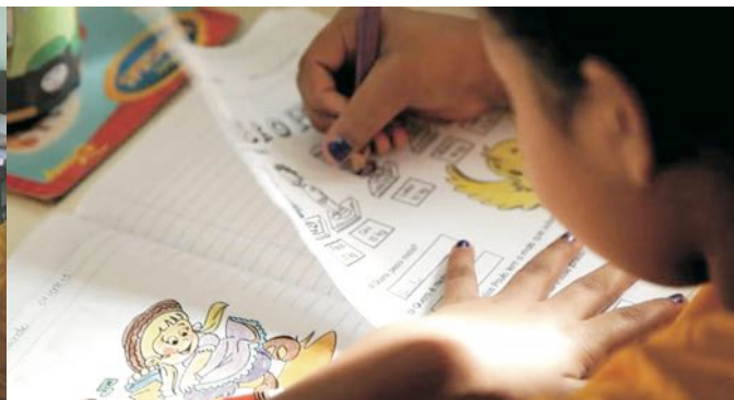
Reforço escolar diário oferecido pelo Curso de Pedagogia.

de geração de renda e consciência ambiental. O projeto foi finalista (num universo de 600 trabalhos) ao Prêmio Santander Universidade Solidária 2011. Hoje em dia este projeto está sendo gerenciado pelo Curso de Administração.